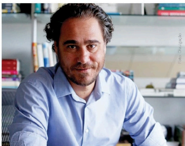
Sidney Quintela, arquiteto por Pedro Hijo Fotos projeto - Xico Diniz