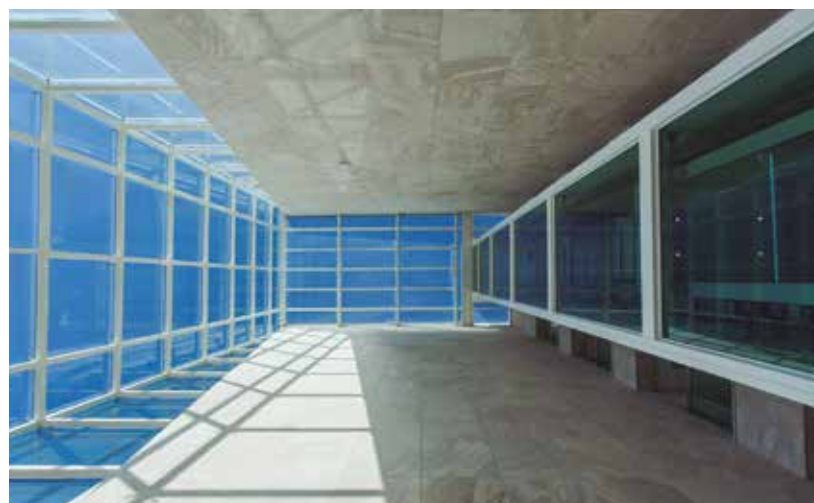
No estar do térreo, poltronas Diz, de Sérgio Rodrigues e mesa de centro do Studio Mais (Básica Home). Persianas com lâminas de madeira de 50 mm (HunterDouglas Luxaflex, fornecidas pela Única) protegem o local do sol enquanto o sistema de refrigeração (JB Ar Condicionado) propicia conforto térmico.

O projeto combinou o limestone Mont Charmot aos fechamentos em vidro que receberam aplicação da película Crystalline (3M). Ela aumenta o conforto térmico dentro do ambiente e reduz os efeitos nocivos causados pelo sol, muitas vezes inclemente na capital baiana. Na imagem, o hall central.